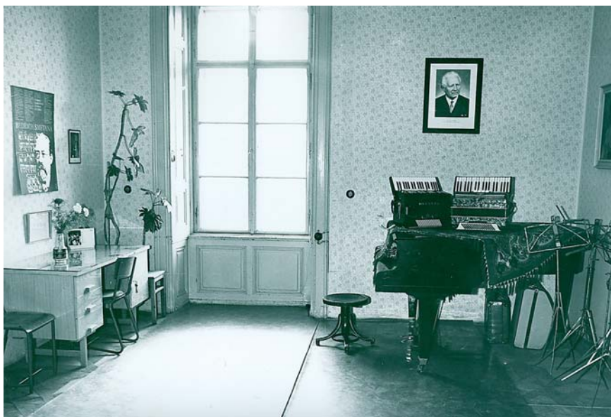
Učebna akordeonu na zámku v roce 1976

hudebního oboru se na škole v letech 1961–1964 zřizuje i obor výtvarný. Stálou součástí školy se však tento obor stává až od roku 1985. Tendence poskytnout dětem možnost co největšího rozsahu uměleckého vzdělávání byla nejvíce naplněna v letech 1988–1991, kdy se vedle hudebního a výtvarného oboru vyučovalo také v nově zřízeném oboru literárně dramatickém.