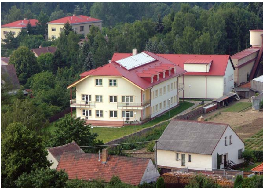
Nová budova ZUŠ v roce 2003

nějším příležitostí, zejména ve spolupráci s bývalým Sbořem pro občanské záležitosti. Škola byla hlavním iniciátorem vzniku a uchování tradice festivalů dechové hudby v Dačicích, na něž byly a jsou zvány nejprve orchestry ZUŠ z Jihočeského kraje a později z celé republiky i ze zahraničí. V roce 1991 u příležitosti mezinárodního projektu uvedení Mozartovy mše vznikl i Pěvecký sbor města Dačic, na jehož činnosti má dačická ZUŠ hlavní podíl.